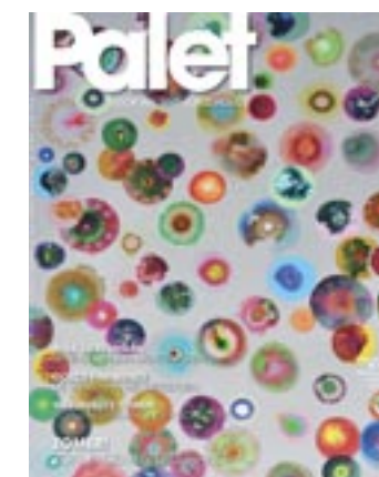
Seet van Hout, Blumenzucht (Retina) , 2014, acrylverf op doek, 195 x 250 cm (fragment)